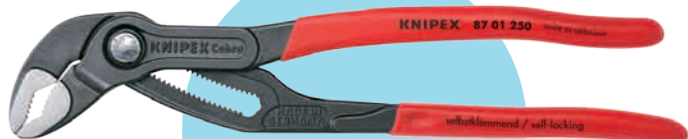
8701-250[ コブラ 250mm]

■ ロングセラー コブラ 250mm とプライヤーレンチ 180mm のセット品