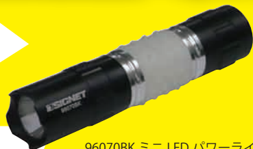
96070BK ミニ LED パワーライト

003120V03 プライヤーレンチ & コブラセット 1 セットに1本ついてくる！