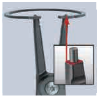
スナップリングが捻れない！