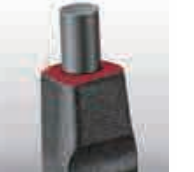
ガタの無い先端チップ