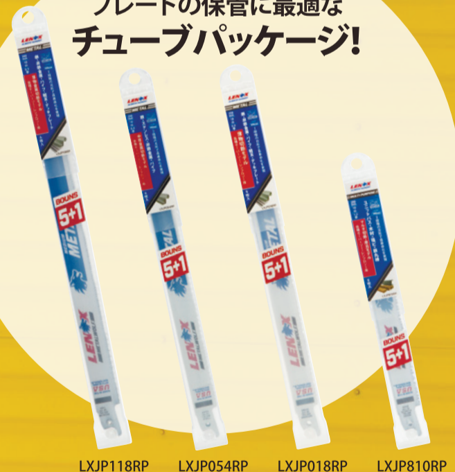
LXJP118RP LXJP054RP LXJP018RP LXJP810RP